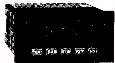
Figura 11. Indicador para sensor de temperatura

En la industria, los controladores pueden manejar, por medio de sus salidas, diferentes dispositivos eléctricos, de acuerdo a un programa o setpoint que debe ser indicado por el usuario. En aparatos electrónicos, este setpoint , viene programado de fábrica y no puede ser variado fácilmente por el usuario. Este es el caso del control de luminosidad de la mayoría de las cámaras fotográficas. (9)