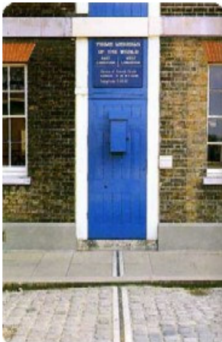
Fotografía del portón de acceso al Observatorio de Greenwich. Pintado sobre la vereda y la calzada se puede apreciar el Meridiano. A la izquierda del lector se encuentra el Oeste, a la derecha el Este.

Lamentablemente los británicos no pudieron hacer pasar el Ecuador terrestre por donde a ellos le cante en ganas, arbitrariamente, como el cero de Greenwich. No. Porque el Ecuador se encuentra donde tiene que estar, y el plano horizontal que lo contiene debe cumplir algunas condiciones, como por ejemplo, que a su proyección le incumbe contener la estrella fija \epsilon de la constelación de Orión, para formar el Ecuador Celeste. Doce grados por arriba y por debajo de esta línea imaginaria, están contenidos todos los signos zodiacales, los planetas, la Luna y el Sol, siendo además el que marca la posición exacta de los puntos cardinales cada 21 de marzo ( equinoccio de otoño en el Hemisferio Austral y de primavera en el Septentrión), las nutaciones y la presesión de los equinoccios, etc.