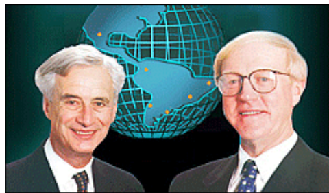
Kaplan y Norton. Padres del Cuadro de Mando Integral

Como decía en el anterior párrafo el CMI no es una herramienta novedosa, el cuadro de mando había sido desarrollado en Europa con anterioridad y especialmente en Francia, donde recibía el título de "tableau de bord", fue el profesor de la universidad de Harvard Robert S. Kaplan y el consultor empresarial David P. Norton los que relacionaron las antiguas herramientas de indicadores con la consecución del cumplimiento del plan estratégico empresarial, publicaron el famoso libro denominado "The balanced Scorecard", convirtiéndose a partir de ese momento en los padres del CMI