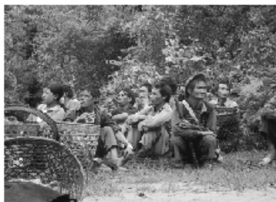
· 中國改革開放了這麼多年，貧富懸殊卻日益嚴重

居民的家庭教育支出高於家庭收入平均增長幾倍，醫療和教育領域成爲盈利企業，引起強烈不滿。在農村，疾病和教育正在成爲新的貧困誘因。他形容「買樓貴、上學貴、看病貴」成爲新的民生三大問題。「上學難、看病難、大中城市行路難」成爲壓在人民頭上的三座大山。