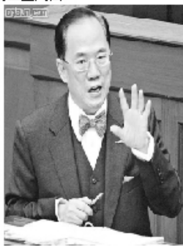
· 特首早前提出了五天工作的建議，到底最終會否惠及基層「打工仔」？