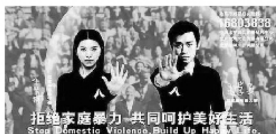
· 在另一方面，家庭暴力亦在中國內地漸被關注 這是一張內地政府宣傳海報

實際上，家庭暴力問題亦不是一朝一夕被提出來的問題。然而，社會、政府、甚至我們自己，亦未必很認真地思想這個問題。當然，社會上其他既問題亦可能是家庭暴力的源頭，可是，當我們不認真研究家庭這個問題，我們亦難以發現引發家庭暴力問題的真相。而且，家庭暴力亦會引起更多的問題，更重要的是兒童的心理發展亦會因家庭暴力而受到不同程度的影響。兒童正正就是我們社會中未來的主人，因此，為了避免將來引起更多的社會問題，對付家庭暴力實在刻不容緩。最後，希望這篇報導可以引起大家對家庭暴力的關注，從而令這個問題得以被根治。