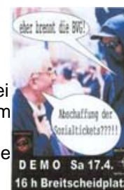
Flyer zum download als .zip (185 kB)