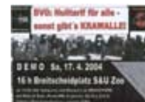
Flyer zum download als .zip (185 kB)