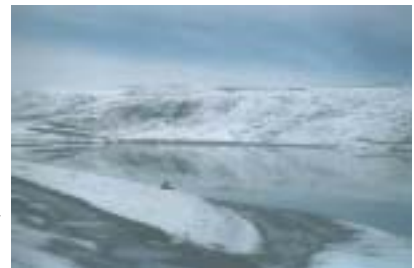
エルチョーロの道のはじまり

ボリビアは9月と10月、雨が降りませんから、一番いきせつです。ボリビアの人は3月と4がつにインカの道へいきます。エルチョーロが一番有名なインカの道です。ラパスからコロイコまでのエルチョーロの道は三日かかります。ラパスは3,600メートルの所にありますが、コロイコは1500メートルの所にあります。リュックとねぶくろとテントがいります。エルチョーロの旅行はあぶなくはないですが、たいへんです。エルチョーロの中にはコタパタ国立公園があります。ねったいうりんとたくさんのどうぶつがいます。旅行のあとで、コロイコでゆっくり、楽しく休むことができます。