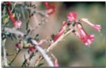
ボリビアの花です。