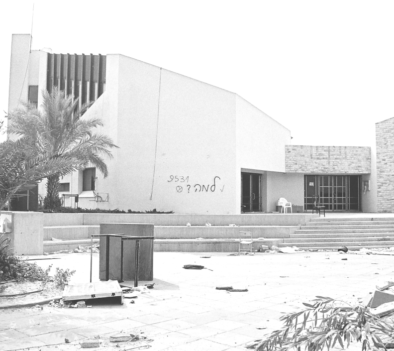
בית הכנסת בנצור חזני