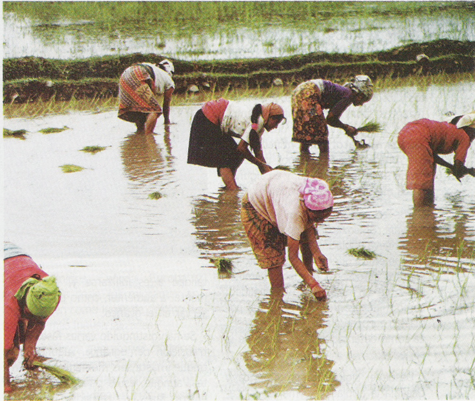
Mujeres en un cultivo de arroz en el oriente asiático. En la actual China existió uno de los mayores imperios agrícolas de la antigüedad.

El comportamiento demográfico en el mundo, a partir del siglo XVI, no