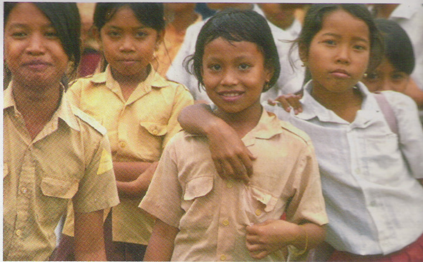
La tendencia de la natalidad, es típica de la fase I, según la transición demográfica.

En Europa occidental, especialmente, durante los siglos XIX y XX, bajo el auge del desarrollo industrial, se presentó una tendencia de crecimiento de la población que generó una especie de modelo, llamado transición demográfica. Este "modelo" sobre el movimiento de la población consiste en el desarrollo inverso entre las curvas de natalidad y mortalidad en el tiempo: la natalidad tiende a disminuir y la mor-