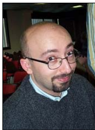
l'uomo che ti deassembla con lo sguardo