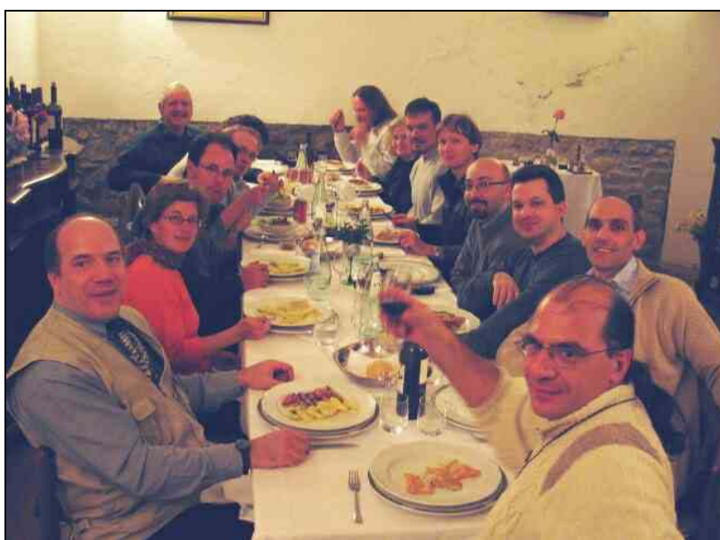
"Social Event" al Ristorante