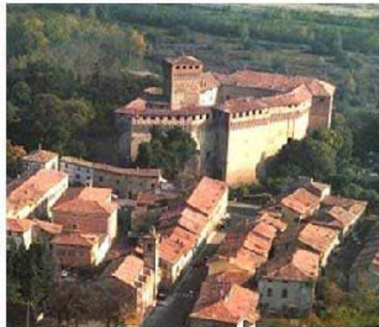
Montechiarugolo - Vista aerea del borgo medievale