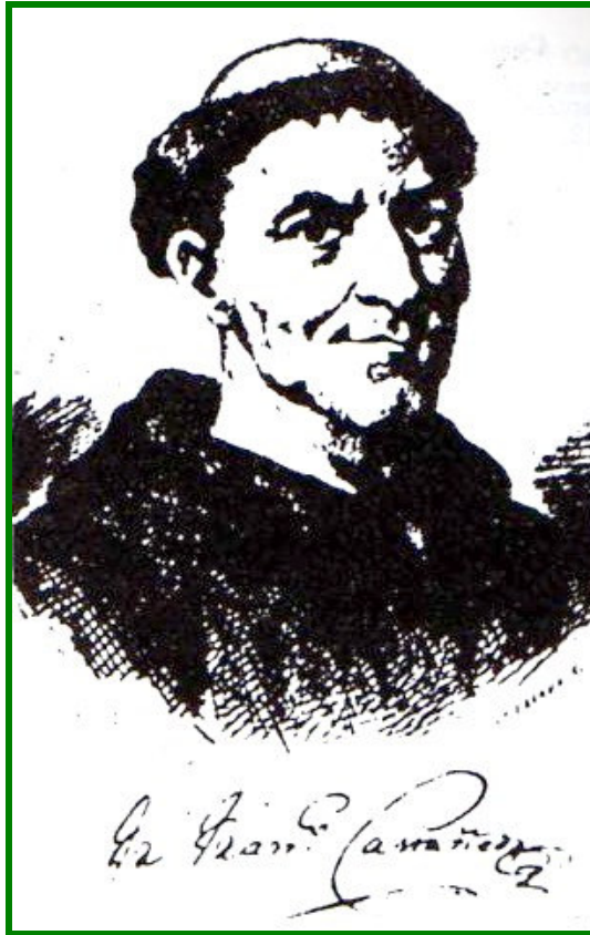
Fray Francisco de Paula Castañeda: uno de los más Grandes y Viejos Camaradas por la Gracia de Dios.