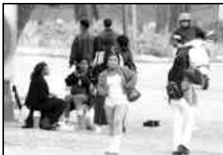
Prostitutas y proxenetas ven en las casas de acogida un alojamiento gratuito y confortable

Se da la circunstancia de que las casas de acogida para mujeres maltratadas se encuentran a rebosar, lo que plantea la primera dificultad a los dirigentes de la Administración