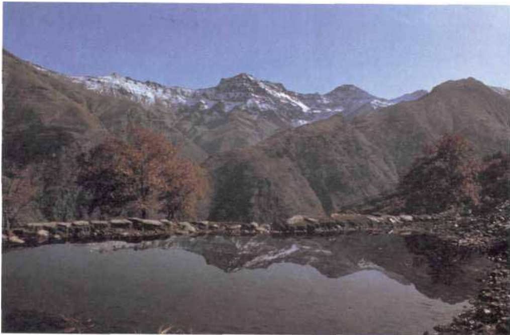
Panorámica desde las inmediaciones del cortijo del Hornillo