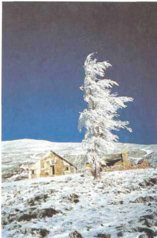
Cortijo de Echevarría.