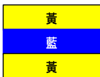
(D) 所有船隻必須在中心範圍內活動 All boats to stay within sight in this center