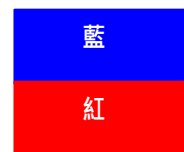
(E) 不准駕風帆 No Sailing