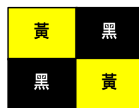
(L) 所有船艇必須立即返回碼頭 All boats to return at once to the pier