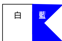
(A) 不准划艇 No Boating