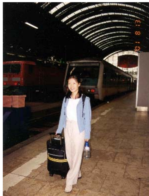
法兰科福中央火车站

我们在车站的自动储物箱存了我们的箱子，就出去遛达了。由于我们没有在新加坡就订好回程时24号晚上在法兰科福住的地方，所以就首先找旅馆。没想到24号正赶上法兰科福有个大博览会，旅馆特别紧张。结果我们事实上用了在法兰科福的整个白天在找旅馆，最后到晚上才找好一个不是很便宜的旅