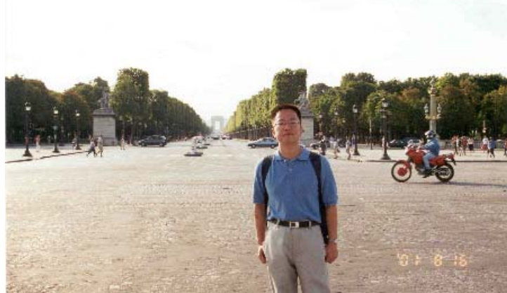
香榭丽舍大道和远处的凯旋门

随后我们来到协和广场(Place de la Concorde)。这里是香榭丽舍大道(Avenue des Champs-Elysees)的终点，也是从罗浮宫延伸过来的杜乐尔花园(Jardin des Tuileries)的终点。所以站在这里，往东可以看到罗浮宫的屋顶，往西可以看到香榭丽舍大道起点凯旋门(Arc de Triomphe)的拱顶。广场的中央是一根可能有三十米高的古埃及的方尖碑，上面尽是古埃及的象形文字。